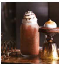
COLD CHOCOLATE THB 140