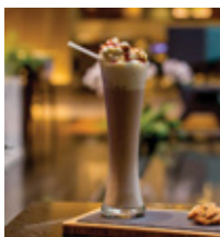
CARAMEL COFFEE FRAPPE THB 140