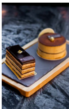
OPERA THB 120

10% Discount for King Power and Accor Plus Members.