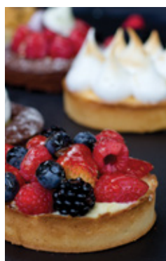
MIXED BERRIES TART THB 120