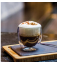
NOCCIOLA GOLOSO THB 140