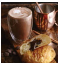
HOT CHOCOLATE THB 140