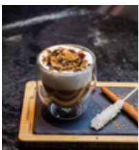
COOKIECINO THB 140