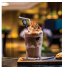
CHOCOLATE MOUNTAIN THB 140