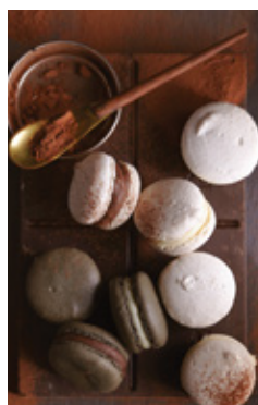
HOMEMADE FRENCH MACARON THB 65