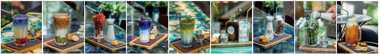
PINK LADY BLUE SKY THB 140