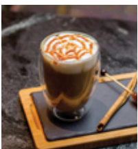
CARAMEL LATTE THB 140