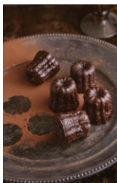
A SET OF 3 CANNELÉS THB 85