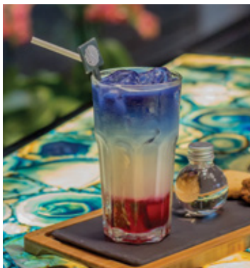
PINK LADY BLUE SKY THB 140

Three Teas Black Tea, Chamomile, Green Tea, Honey, Peach and Basil 200