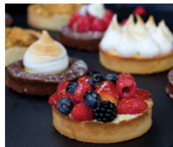
MIXED BERRIES TART THB 120