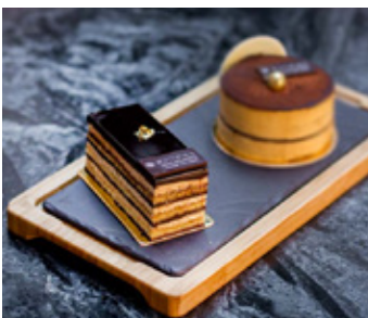
OPERA THB 120