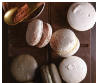
HOMEMADE FRENCH MACARON THB 65