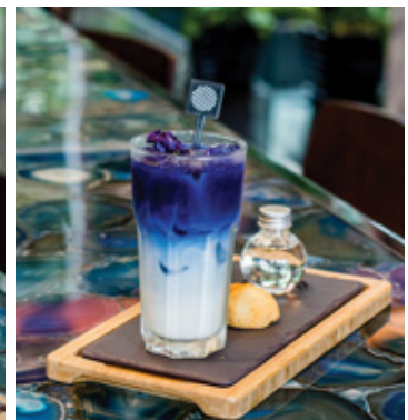
BUTTERFLY PEA HOT & COLD THB 140