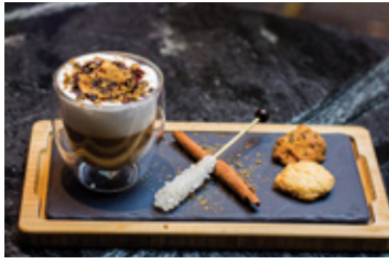
COOKIECINO THB 140