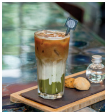
MATCHA ESPRESSO LATTE THB 140