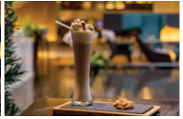
CARAMEL COFFEE FRAPPE THB 140