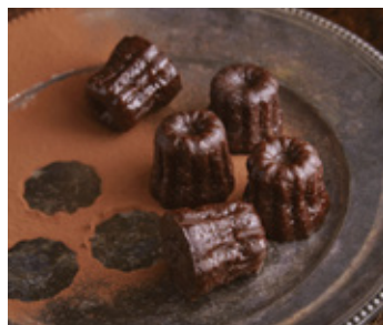
A SET OF 3 CANNELÉS THB 85