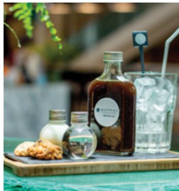
BLACK TEA THB 140