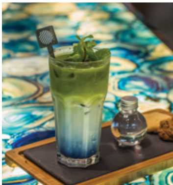
BLUE GREEN TEA THB 140