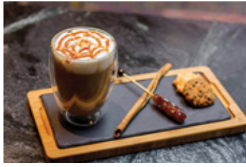
CARAMEL LATTE THB 140