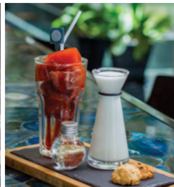
THAI TEA THB 140