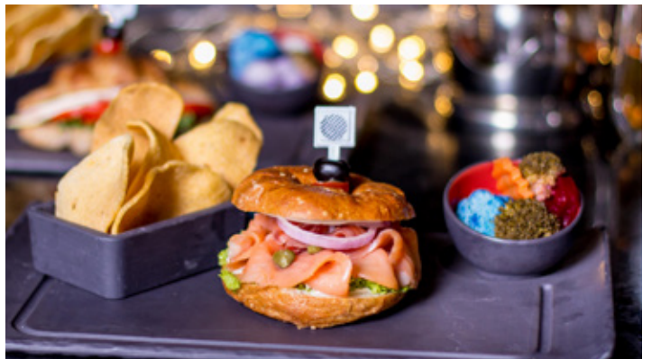
SMOKED SALMON BAGEL THB 290