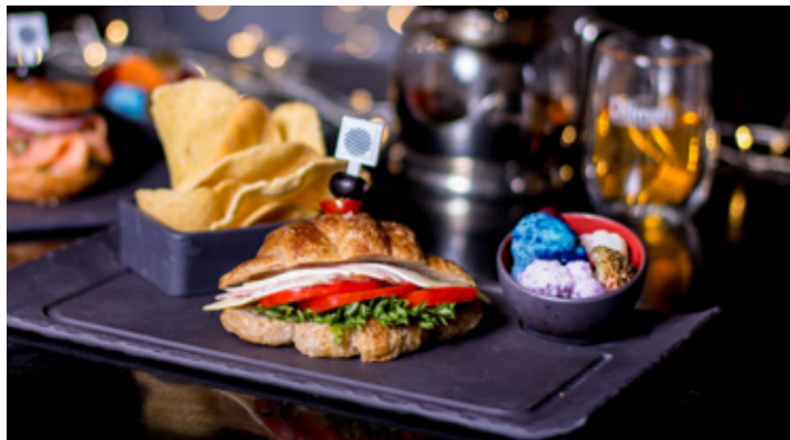
RICEBERRY CROISSANT HAM CHEESE THB 190