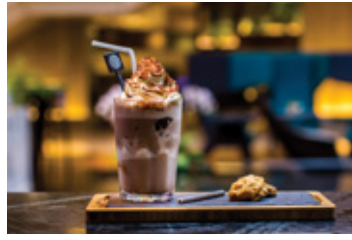
CHOCOLATE MOUNTAIN THB 140