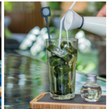
GREEN TEA THB 140