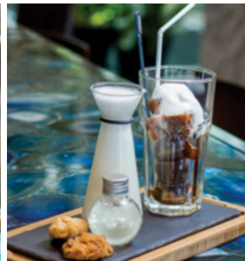
CAPPUCCINO THB 140