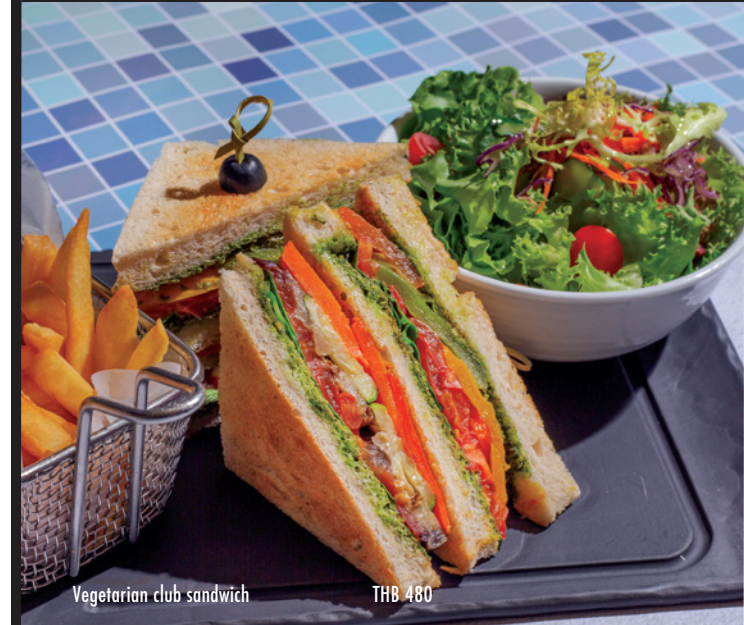
Vegetarian club sandwich THB 480