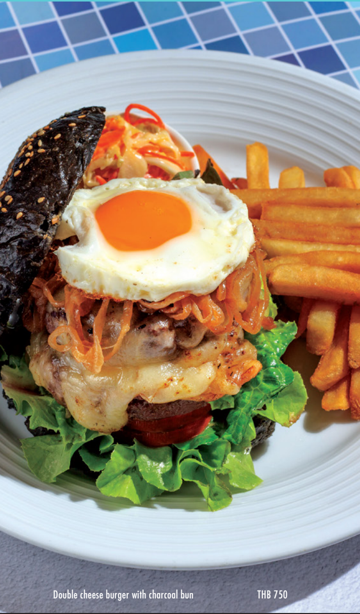
Double cheese burger with charcoal bun THB 750