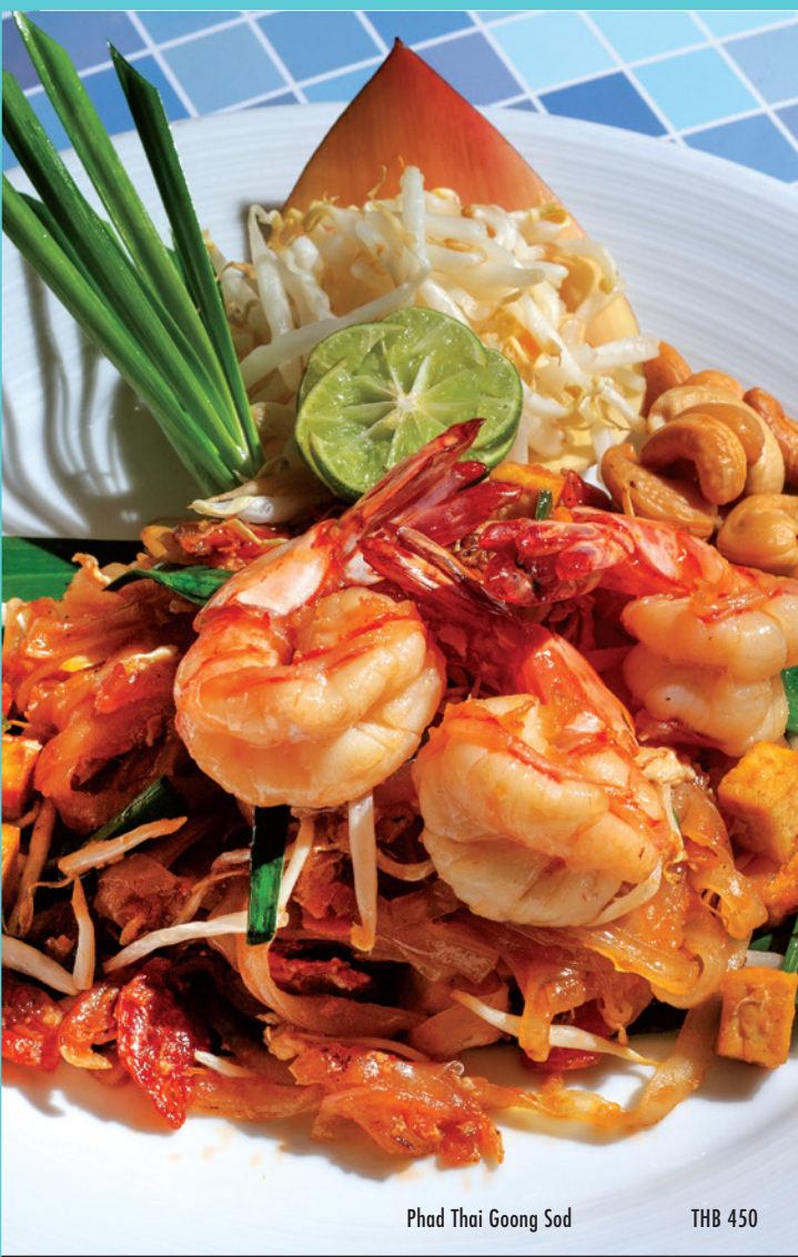
Phad Thai Goong Sod THB 450