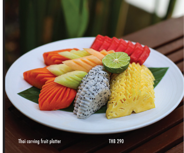
Thai carving fruit platter THB 290