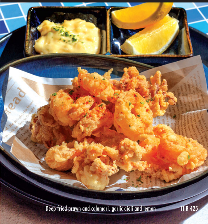
Deep fried prawn and calamari, garlic aioli and lemon THB 425