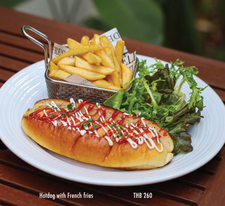
Hotdog with French fries THB 260