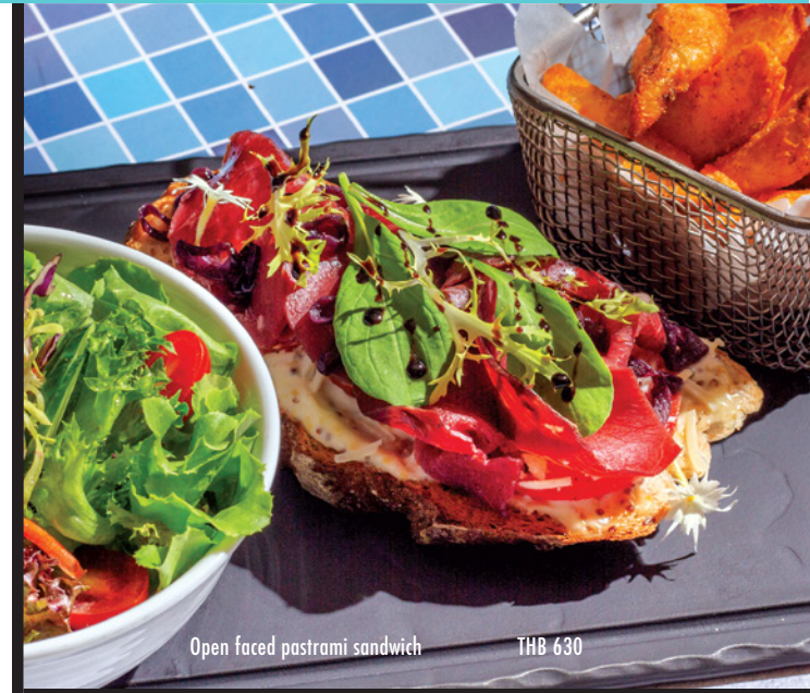
Open faced pastrami sandwich THB 630

H : healthy อาหารเพื่อสุขภาพ V : vegetarian อาหารมังสวิรัติ P : pork มีส่วนผสมของหมู 🌾 : gluten free ปราศจากกลูเตน 🥜 : contains nuts มีส่วนผสมของถั่ว