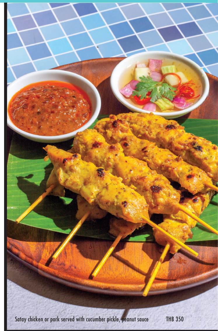
Satay chicken or pork served with cucumber pickle, peanut sauce THB 350